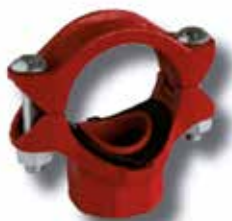
Derivación simple ranurada