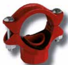
Derivación simple roscada