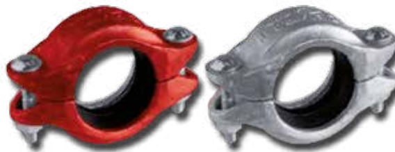
Acoplamiento flexible normal Admite el movimiento controlado lineal y angular, que acomoda la deflexión de la tubería y la expansión y contracción térmica