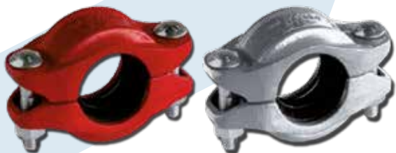
Acoplamiento rígido normal. No admite movimiento, es similar a una unión bridada o soldada